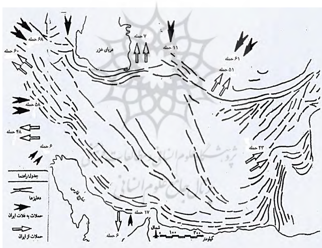
شکل ۲. جهت تهاجم‌های خارجی و بالعکس (از هخامنشی تا جمهوری اسلامی)

۸. از نظر ژئواکونومی این منطقه از نظر کارکردهای مکانی-فضایی قابلیت تولید قدرت در کشور را دارد؛