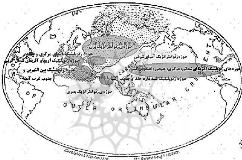
شکل ۱. دسترسی موقعیت ژئوپلیتیک ایران به قلمروهای ژئواستراتژیک و ژئوپلیتیک (مکیندر، ۱۹۰۴: ۴۲۱-۴۳۷)

موقعیت جغرافیایی ایران از پایدارترین عوامل تأثیرگذار بر قدرت ملی این واحد سیاسی است. بر این پایه، افرادی بر این باور هستند که «آنچه موجب اتصال و ارتباط ایران با نظام جهانی و تأثیرگذاری و تأثیرپذیری ایران در سده اخیر شده، موقعیت جغرافیایی در چهارراهی کشور ایران بوده و این عامل ایران را با نظام بین‌الملل مرتبط کرده است» (اطاعت، ۱۳۹۱: ۵۴). برژینسکی ایران را در یکی از شش منظومه قدرت قرار می‌دهد: ۱. منظومه آمریکای شمالی، ۲. منظومه اروپا، ۳. منظومه آسیای شرقی، ۴. منظومه آسیای جنوبی، ۵. منظومه ناموزن مسلمانان و ۶. منظومه احتمالی اوراسیا. هریک از این منظومه‌ها ویژگی‌های خاص دارند. سه منظومه اول مصرف‌کنندگان اصلی انرژی هستند. منظومه ناموزن مسلمانان که شامل خاورمیانه و شمال آفریقا است، تنها تولیدکننده‌های انرژی هستند که در این میان، منطقه خلیج فارس، منطقه صادرکننده مواد خام است (نامی و دیگران، ۱۳۸۸).