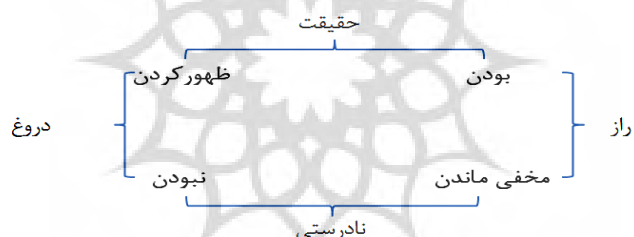
مدل ۳: مربع حقیقت‌نمایی

مربع حقیقت‌نمایی به‌منزله گونه‌ای از مربع معناشناسی، ابزاری مناسب برای تحلیل این داستان است. در داستان «مردی در قفس» مفاهیم ظهور، حقیقت و یا دروغ معانی خاصی به خود می‌گیرند که در طول داستان اثرگذار می‌شوند. سید حسن خان از زمان مرگ سودابه، خود را در خانه پدری‌اش مخفی کرده است و هیچ‌کس او را نمی‌بیند. همین امر باعث می‌شود حقیقت زندگی او در تقابل با آنچه دیگران درباره‌اش خیال‌بافی می‌کنند، در تعارض قرار گیرد.