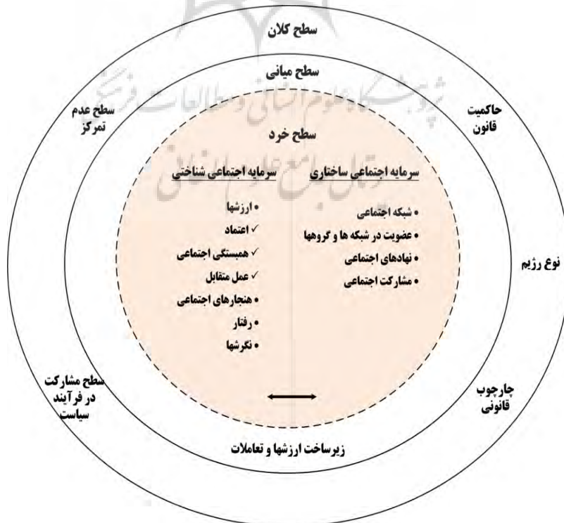
تصویر ۱. چهارچوب مفهومی سطوح و انواع سرمایه اجتماعی.

در مقاله حاضر با توجه به ماهیت تحقیق که بومی‌سازی