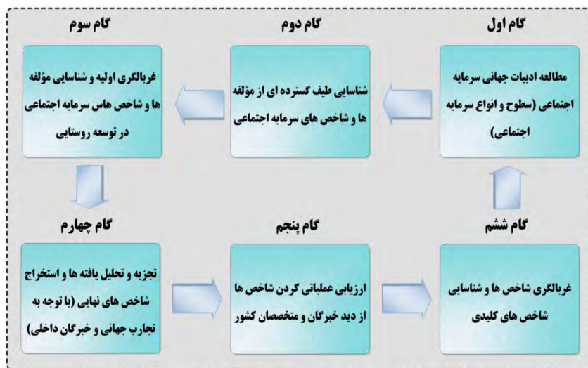
تصویر ۲. فرایند طراحی و تبیین شاخص‌های سرمایه اجتماعی در توسعه روستایی.

اشاره شد. به همین منظور و نیز به منظور جلوگیری از طولانی شدن فرایند مقاله، از گام سوم تا گام ششم این فرایند در توسعه روستایی شرح داده می‌شود.