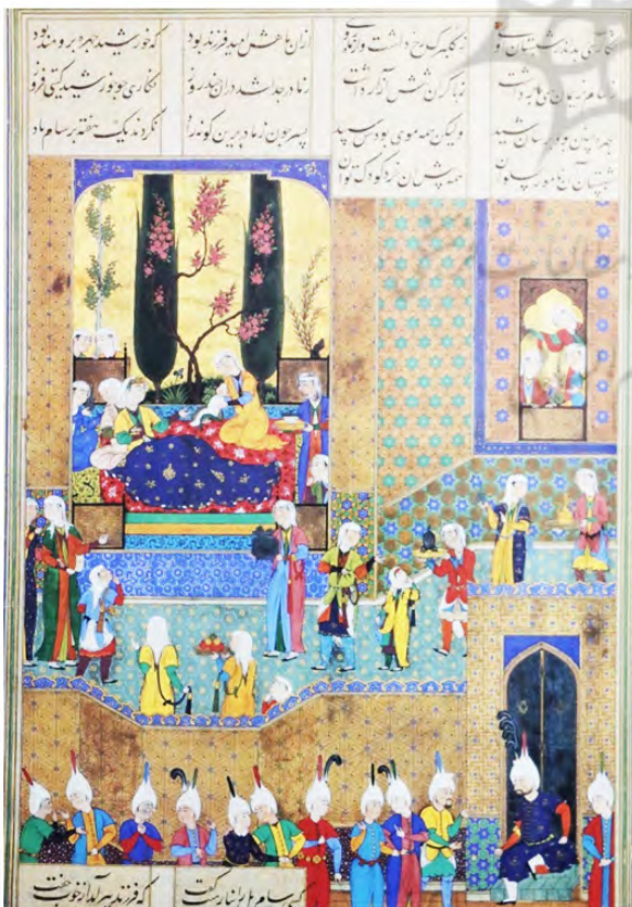
تصویر ۶. همان، سام زال را ترک می‌کند. سده شانزدهم.

این می‌تواند از دلایلی باشد که شاعر فریدون را به سرو مانند کرده است. سرو در هر آب وهوایی می‌روید، مقاوم و ایستاست، نماد مردان بزرگ است و همواره در هنر ایران نقش اساسی داشته است. مطابق روایات ایرانی زرتشت این درخت را از بهشت آورد و پیش در آتشکده کاشت (یاقعی، ۱۳۸۸: ۴۶). در اینجا نیز پیوند نگارگری با ادبیات به خوبی نمایان است، ذهن نگارگر با ذهن شاعر یکی بوده، نگارگر ایرانی با بهره گرفتن از شعر، عناصر و نمادهای آن و با استفاده از تخیل خود، اثری بی نظیر خلق می‌کند.