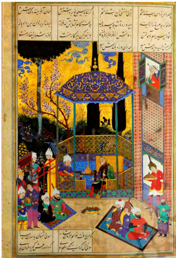
تصویر ۵. همان، تولد زال، سده شانزدهم.