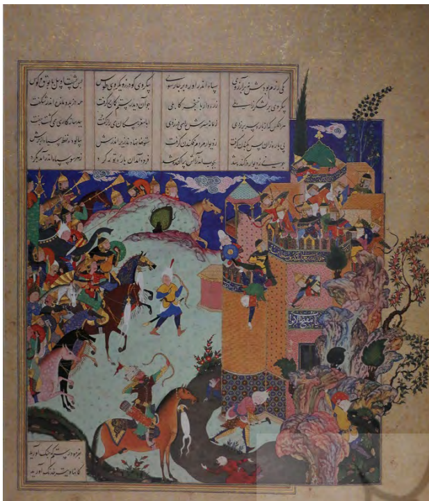
تصویر ۸. همان، رستم قلعه بیداد را خراب می کند، سده شانزدهم.