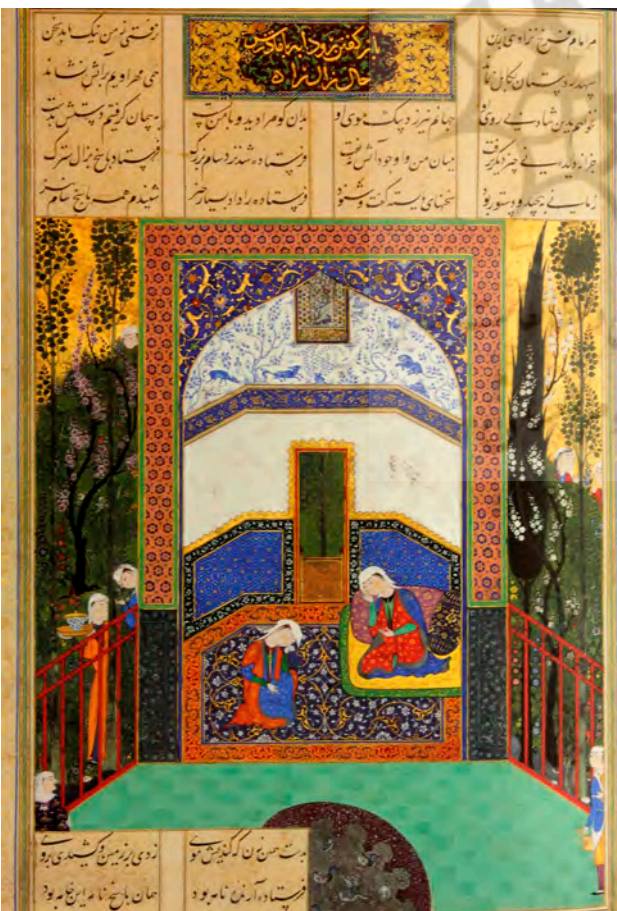
تصویر ۷. همان، آگاهی یافتن سیندخت از حال دخترش رودابه، سده شانزدهم.

نگ داشتن چنین فرزندی را بر نمی تافت فرمان داد تا او را برداشتند و از آن بوم به البرزکوه بردند و بر ستیغ آن کوه نزدیک خانه سیمرغ بنهادند و بازگشتند (رستگار فسایی، ۱۳۸۸: ۴۸۵). طرد کردن زال توسط سام و سرگردان شدن او نیز می تواند ارتباط نمادین زال با درخت سرو باشد. نیز نام زال به معنای "نزار و ناتوان از پیری" است (کزازی، ۱۳۸۶: ۳۹۳). لفظ پیر شکلی از "پئیریک" است که به معنای روح درخت و چشمه هاست (بهار، ۱۳۷۶: ۲۶۱) که دلیل دیگر برای ارتباط زال با درخت می تواند باشد.