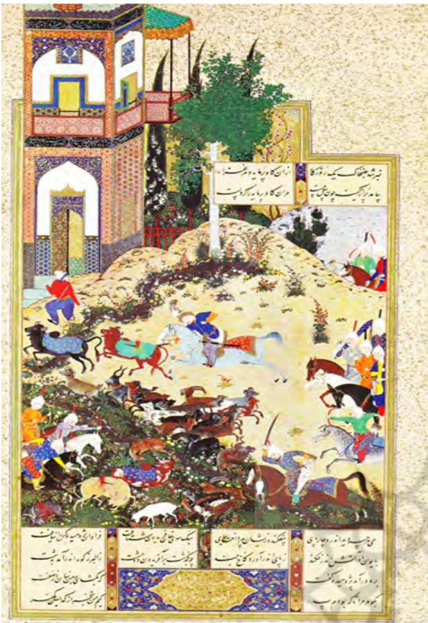
تصویر ۳. شاهنامه تهماسبی، ضحاک گاو برمایه را می کشد. سده شانزده/ده.