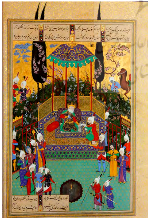
تصویر ۴. شاهنامه تهماسبی، فریدون سر تور را دریافت می کند. سده شانزده/ده.