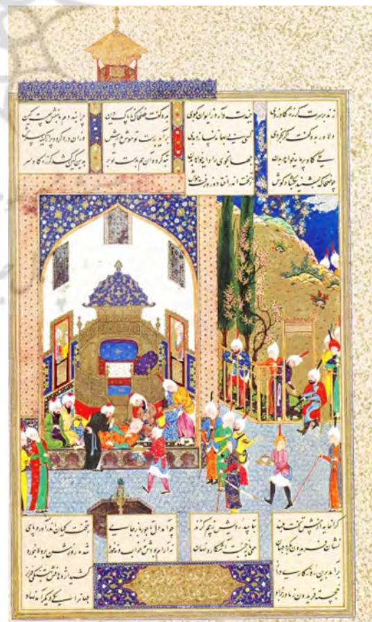
تصویر ۲. شاهنامه تهماسبی، تعبیر کردن خواب ضحاک. سده شانزده/ده.