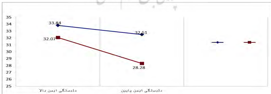
نمودار ۱. وضعیت تعامل میانگین چهار گروه ایجاد شده از لحاظ میانگین نمره‌های کیفیت زناشویی

همان‌طور که در جدول ۳ مشاهده می‌شود، تعامل دل‌بستگی ایمن و محبت جسمی میزان واریانس تبیین شده‌ی متغیر ملاک یعنی کیفیت زناشویی را ورای هر دوی آن‌ها از ۰/۳۳ به ۰/۳۷ افزایش داده است. ضرایب رگرسیون مربوط به تعامل این سه متغیر ( \beta = -۱/۸۷ ) ، نشان می‌دهد که این افزایش از لحاظ آماری معنی‌دار است؛ و می‌توان اظهار داشت که محبت جسمی تعدیل کننده رابطه میان دل‌بستگی ایمن و کیفیت زناشویی در زنان است.