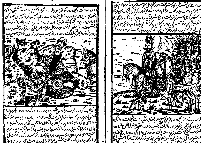
شکل ۱: تصویر صفحه‌ای از نسخه چاپ سنگی رستم‌نامه به قلم مهدی پروانه شیرازی (کتابخانه آستان قدس رضوی، نسخه ۱۰۹۳۶).