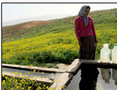
تصویر ۴. ادراک بویایی در زندگی عشایری، آب چشمه در کنار گیاهان صحرائی.

صداها و بوی مکان‌ها به همان اندازه در ادراک محیط سهیم‌اند، که حس بینایی در آنها مشارکت دارد. یک رایحه در برانگیختن حافظه قوی‌تر از حس بصری عمل کرده و وارد فازهای ناخودآگاهی می‌شود. معماری نیز می‌تواند واجد حس بویایی باشد، رایحه محل سکونت، با ویژگی‌های به خصوصی که در هر مکان پیدا می‌کند در تصویر ذهنی انسان از محل سکونت وی نقش مؤثری دارد. غالباً «یک بوی ویژه باعث می‌شود دوباره وارد فضایی شویم که حافظه بصری به کل آن را فراموش کرده باشد» (پلاسما، ۱۳۸۸: ۶۷) در یک مکان سکونت عشایری، خانه به دلیل قرارگیری بی‌واسطه در طبیعت اغلب با روایح بسیاری همراه است. عطر گیاهان وحشی در محیط کلی فضای یورد احساس شده و در کیفیت غذای طبخ شده و آبی که از چشمه نوشیده می‌شود مؤثر است. همچنان که جداره‌های خانه مانعی در برابر رایحه محسوب نمی‌شود. در بازدید از شهرک‌های عشایری، دلتنگی برای هوای آزاد از مهم‌ترین عواملی محسوب می‌شود که تحمل شهرنشینی را دشوار می‌کند. همچنین به دلیل تمایل استفاده از هوای آزاد و رایحه مراتع ترجیح به زندگی در سیاه‌چادر با وجود عدم امکان امتداد زندگی عشایری به لحاظ تفاوت در امکانات معیشتی همچنین وجود دارد (تصویر ۴).