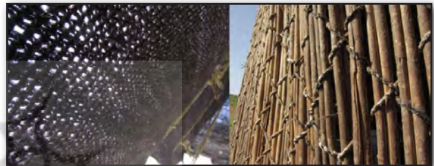
تصویر ۵. ادراک لمسی، جداره‌های خانه از چیغ و بافت درشت سیاه‌چادر در برانگیختن حس لامسه مؤثر است.

ادراک لمسی به عنوان یک حوزه قوی نفوذ به جهان شناخته شده، که عمق تجربه در مقایسه با ادراک بصری و ماندگاری و قدرت یاری بخشی آن به بازخوانی حافظه قابل توجه است. در این زندگی، مکان با استفاده از سرپناهی معنا پیدا می‌کند که با دست بافته شده است و به لباس شباهت پیدا می‌کند. تهییج مداوم ادراک لمسی از تفاوت‌های بسیار مهم زندگی عشایری با زندگی شهری است. تجربه یک یورد عشایری با تجربه و ارتباط دست با پوست و پشم حیوانات، آبی که از چشمه می‌جوشد، گل‌ها و گیاهان صحرایی که در پخت غذا و برای رنگ آمیزی پشم در دست بافته‌ها کاربرد دارد، در کنار تجربه پای انسان از تفاوت نرمی سطوح پوشیده از خاک، سنگ و علف موجب می‌شود تصویر بدنی این افراد در زندگی شهری تطابق با تصویر عشایری آن نداشته باشد (تصویر ۵).