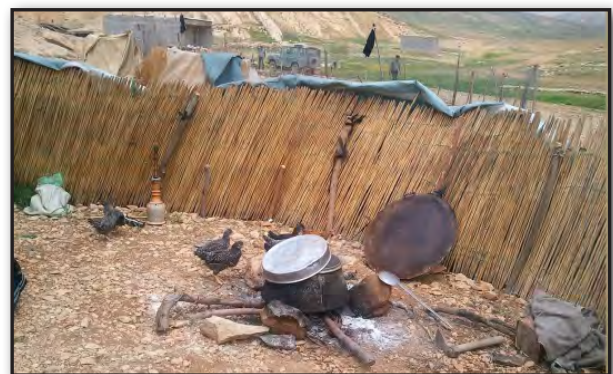
تصویر ۶. حس فهم دما، اجاق و نقش مؤثر آن در زندگی عشایری.

به عنوان یک تفاوت مهم بیرون و درون در معنا بخشیدن به مفهوم مسکن موفق عمل می‌کند، این حس مانند سایر حواس به حافظه ما متصل است. در زندگی عشایری به دلیل حضور کمتر وسایل تنظیم‌کننده درجه حرارت، مواجهه طبیعی با جهان و ادراک تنوع حرارتی، امکان‌پذیر است. تجربه دماهای پایین هوا در فضای بیرونی و شب‌های خنک بیلاقی و نقش گرمابخش و سرنمونی آتش، نقش مؤثر آن را در القای حس مسکن، تشدید می‌کند (تصویر ۶) همچنین نقش خنک‌کننده چادر در طی روز آن را دلخواه می‌کند.