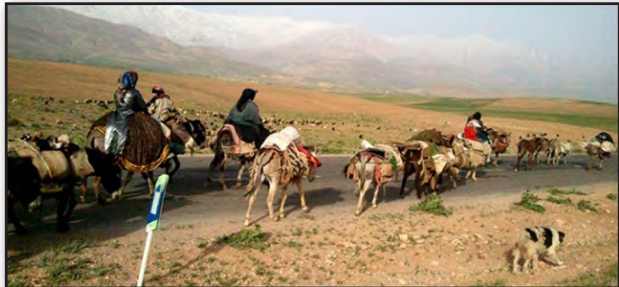
تصویر ۳. ادراک سمعی، پدیده کوچ به عنوان بخش مهمی از زندگی عشایری با صداها و ویژه خود همراه است. مأخذ: نگارندگان، ۱۳۹۱.

با آداب و رسوم به خصوص این قوم هماهنگ است در کنار صدای صحبت انسان‌های آشنا از دیگر خصوصیات زندگی در یک مکان عشایری است (تصویر ۳).