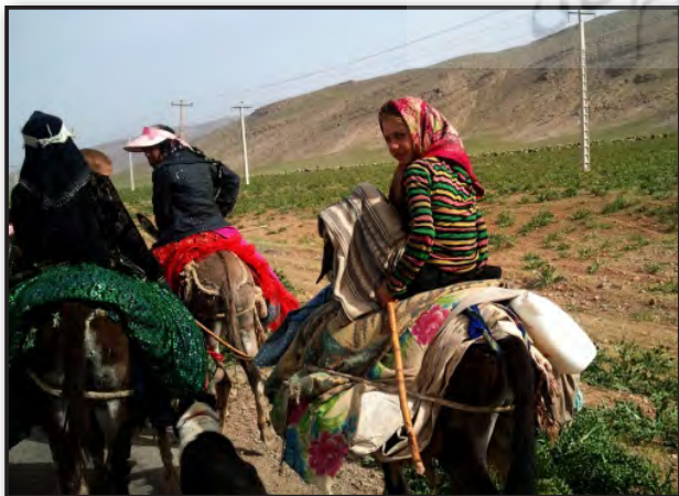
تصویر ۲. کودکان و توانمندی در کوچ، پادناي سمیرم. مأخذ: نگارندگان، ۱۳۹۱. Fig. 2. Children and their capabilities in migration - Padena Samirom, Source: The authors, 2012.

این آسایش رفتاری همچنان به دلیل وجود گستردگی خانه‌ها در دل دشت و فاصله طبیعی بین چادرهاست که امکان وجود دید مستقیم یا انتقال صدای مشخص را به حداقل رسانده و به طور مؤثری به ایجاد خلوت منجر می‌شود. ۲۰ در نمونه‌های اخیر مورد