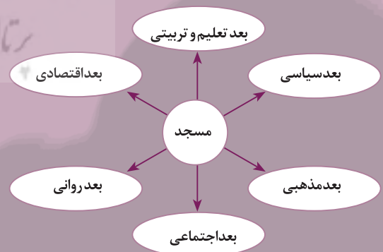
نمودار شماره ۲: مؤلفه‌های استخراجی مربوط به معرفی مسجد در کتاب داستان راستان (جلد اول و دوم)