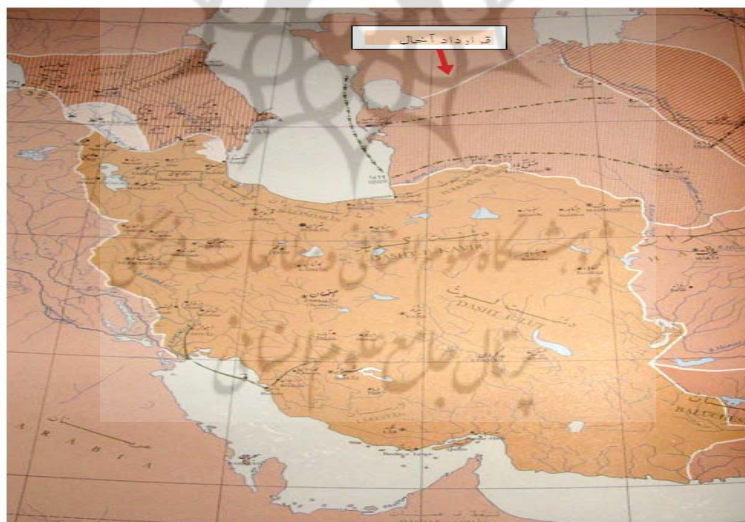
شکل (۱) نقشه سرزمین‌های جدا شده از ایران طبق قرارداد آخال (آخال - تکه) (موسسه جغرافیای دانشگاه تهران، ۱۳۵۰: ۲۸)

سال‌های ۱۸۷۳ تا ۱۸۸۱ علاوه بر اشغال خوارزم، ایلات ترکمن را نیز شکست داده بودند و سرزمین ترکمن‌های تکه را با نام «سرزمین ماورای خزر» به خاک خود ملزم کردند. با این پیمان ناصرالدین‌شاه حکومت روسیه را بر این مناطق به رسمیت شناخت و ایران و روسیه برای اولین بار در ناحیه شرق دریای خزر با یکدیگر همسایه شدند. پیمان آخال تأثیر دوگانه‌ای بر ایران داشت. از یک سو ایران تا حدی از یورش‌های ترکمن‌ها رهایی می‌یافت اما این امر به بهای گران از دست رفتن سرزمین‌هایی به دست آمد که ناصرالدین‌شاه ادعای سلطنت بر آنها داشت (میرحیدر، ۱۳۵۶: ص ۱۸۵). این پیمان همچنین به ضرر ایلات و عشایر ترکمن‌ها بود و با مصالح سنتی قوم ترکمن هم‌خوانی نداشت. میان آنان مرز کشی شده و در دو کشور جداگانه قرار می‌گرفتند و اتحاد آنان به هم می‌خورد. یموت‌های ایران که بر اساس موافقت‌نامه دو دولت هر سال برای چراندن گله‌های خود به آن سوی مرز کوچ می‌کردند باید به هر دو دولت مالیات می‌دادند و این موضوع مقامات روسی و ایرانی را در جمع‌آوری مالیات دچار مشکل کرده بود.