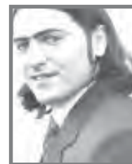
محمد صادق امینی

مدیر کل آژانس بین‌المللی انرژی اتمی نیز در موضع‌گیری خود در خصوص گزارش مذکور گفته است: "ایران به نحوی با این گزارش حقانیتش تأیید شد و برآورد اخیر جاسوسی آمریکا به منزله "آهی از سر راحتی" برای ماست زیرا نتایج آن با یافته‌های آژانس بین‌المللی انرژی اتمی مطابقت دارد". البرادعی در ادامه‌ی اظهارات خود با اشاره به اینکه انتشار این برآورد بهترین فرصت ممکن را برای مذاکرات بین‌المللی با ایران بر سر برنامه هسته‌ای