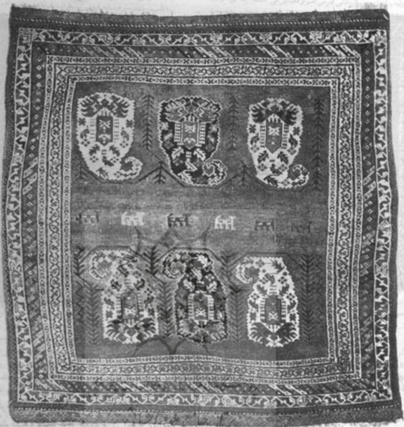
پارچه قالی باستان

محققین و کارشناسان، تاریخ بافت قالی را به قرن ششم قبل از میلاد نست می دهند، اما هنوز موفق به شناسایی اولین کشور بافنده فرش نشده اند.