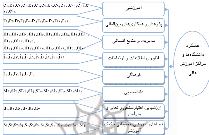
نمودار ۲ مدل مفهومی سطح ۲

گام ششم: در این گام، برای بررسی اینکه هر یک از شاخص‌های مطرح شده تا چه اندازه با عوامل به دست آمده مرتبط هستند، پرسشنامه ۴ تدوین شد. در این پرسشنامه هریک از پاسخ‌دهندگان با استفاده از طیف لیکرت (۱ تا ۹) میزان ارتباط شاخص مطرح‌شده و عامل مربوطه را موردسنجش قرار دادند. این پرسشنامه در اختیار دو گروه خبرگان و مجریان قرار گرفت و هریک از این دو دسته، به فراخور تجربه و حوزه کاری خود به آن پاسخ دادند. گام هفتم: داده‌های مربوط به این دو گروه پاسخ‌دهنده با استفاده از تحلیل عاملی بررسی شدند. تحلیل عاملی انجام شده در این پژوهش به صورت تحلیل عاملی اکتشافی انجام شده است تا مشخص شود که آیا نظرات گروه خبرگان در پرسشنامه سوم با آنچه که مجریان و خبرگان در پرسشنامه چهارم عنوان کرده‌اند، همخوانی دارد یا خیر. در تحلیل انجام‌شده با استفاده از نرم‌افزار، چون مقدار KMO به دست آمده بزرگ‌تر از ۰/۶ می‌باشد و کای دو حاصل از اجرای آزمون بارتلت برای شاخص‌های یادشده در سطح معناداری ۰/۰۰۵ کوچک‌تر از ۰/۰۵ می‌باشد، تحلیل عاملی انجام شده موردتأیید قرار