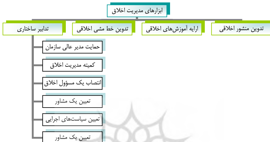
شکل ۱: ابزارهای مدیریت اخلاق

در بین ابزارهای متعدد مدیریت اخلاق، برخی از ابزارها کاربردی بیش‌تری دارند. این ابزارها عبارتند از: تدابیر ساختاری، خط مشی‌ها و رویه‌ها و آموزش کارکنان و تدوین منشور اخلاقی (سلطانی، ۱۳۸۲، ص ۳۶). در ادامه به تشریح اجمالی ابزارهای اخلاقی و در نهایت به مبحث تدوین منشور اخلاقی می‌پردازیم.