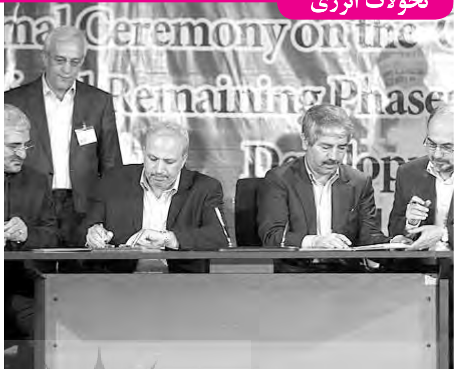
ماموت گازی پارس