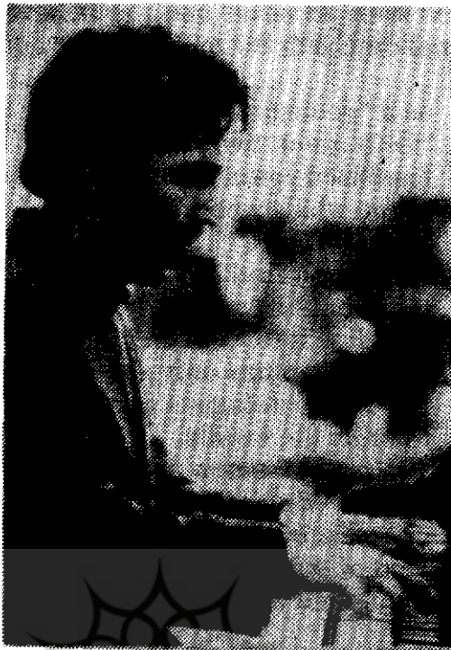
● ولادیمیر آشکنازی