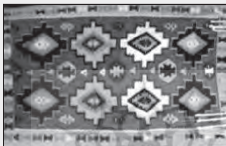
تصویر شماره ۴

در رنگ‌های متنوع بر پس زمینه‌ای رنگی، ترکیبی بسیار شاد و روحبخش ایجاد می‌کنند. در تصویر شماره ۴، قسمتی از گلیم را با نقش تخته‌ای بر زمینه‌ای قرمز رنگ می‌بینیم که شبیه تخته فرش است و آن را از حالت نقوش گلیم بیرون آورده است. شاید وجه تسمیه این نقش هم، از این جهت بوده باشد که گلیم را شبیه تخته فرش کرده است. از دیگر نقوش پرکاربرد، نقش راه‌راه است که به استادکار بافنده، این امکان را می‌دهد که از هر نقشینه‌ای که مایل باشد، در راه‌های آن بهره بگیرد. نوارهای پهن به ابعاد مختلف در رنگ‌ها و طرح‌های گوناگون که در هر چهار تا پنج راه تکرار می‌شود. این نقش،