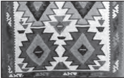
تصویر شماره ۵

قسمتی از گلیم با نقش آینه گل