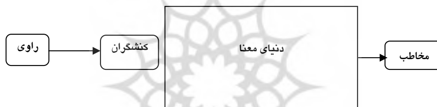
شکل ۲ سطوح اثر ادبی

هر اثر ادبی از سه سطح راوی، کنشگر و مخاطب (روایت‌شنو) تشکیل شده است. این سه سطح در تقابل با یکدیگر، باعث به وجود آمدن گونه‌های روایی با سطوح مختلف آن می‌شوند.