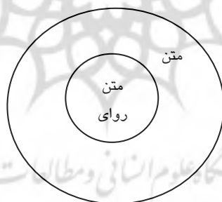
شکل ۱ رابطه متن و متن روایی

آنچه باعث تبدیل یک متن به متن روایی می‌شود، عامل «داستان» است و از ترکیب سه عامل «داستان»، «روایت» و «متن»، متن روایی به وجود می‌آید. شکل زیر ساختار متن روایی را نشان می‌دهد: