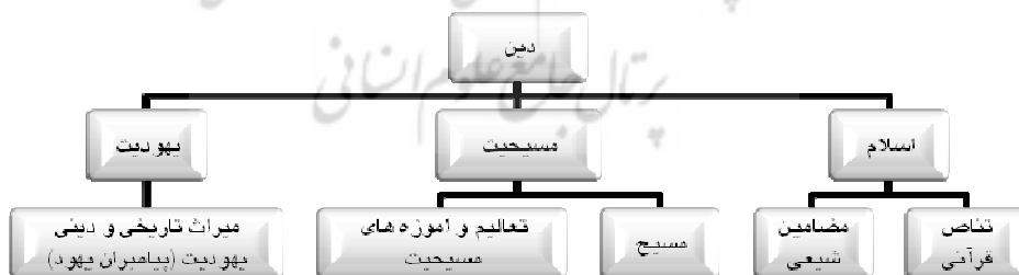
نمودار ۴ درونمایه‌ی دین را در دوسرزمین

عجین شده است. شعر حسینی و امین‌پور تبلور خالص‌ترین اندیشه‌های الهی و باورهای دین اسلام است.