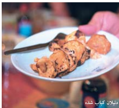
دنبلان کباب شده