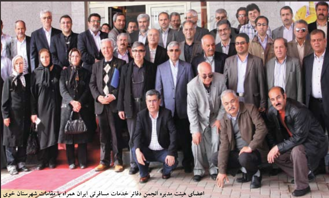
اعضای هیئت مدیره انجمن دفاتر خدمات مسافرتی ایران همراه با مقامات شهرستان خوی