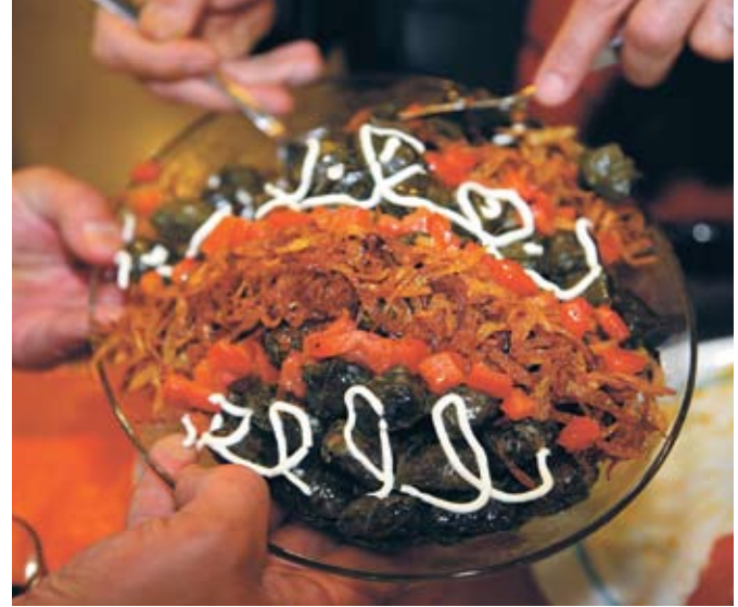
در روز پایانی سفر، گروه با انواعی از غذاهای محلی که توسط خانم خوش ذوق و با قریحه از اهالی خوی طبخ شده بود حسابی غافلگیر شدند.

می‌کند ممکن است روزی این کار را توسعه دهد.