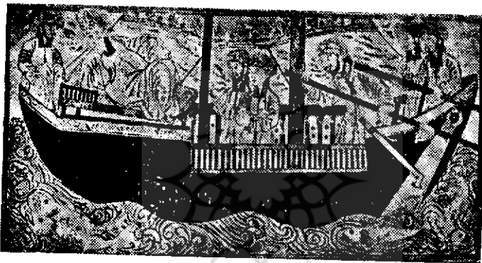
نوح و خاندان او در کشتی (از نسخه جامع التواریخ مجمع همایونی آسمانی لندن)

چون در اینجا بکتاب معجم الألقاب ابن الفوطی که فقط يك جزء ناقص از آن بدست مانده اشاره شد و نظر باینکه بیشتر غرض ما از نوشتن این مقاله احیای نام و آثار هنرمندان عصر خواجه رشیدالدین فضل الله و ایلخانان معاصر اوست میگوئیم که همین ابن الفوطی در آن جزء از کتاب معجم الألقاب که باقیست از يك تن دیگر از نقاشان