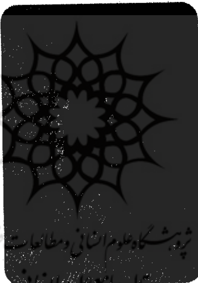
شیخ فضل الله نوری بالای دار

تلگرافات و مکتوبات شما همه را در دست دارند که اثناء فساد کرده، به شرکت ایشان خون ها ریخته و خانه ها بر باد دادید و آتش به دودمان ها زدید که هنوز دود آن فضا را تیره کرده، مگر این مردم