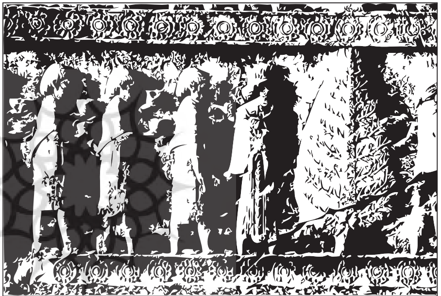
نمایی از نقش برجسته‌های تخت جمشید

در این کتاب در می‌یابیم که بته‌جقه از جمله آرایه‌هایی است که از دوران باستان تا به امروز در روی بسیاری از آثار هنری ایران خودنمایی می‌کند. از طرفی چگونگی زایش و ماهیت و نمادین بودن آن ننگاره موجب بروز اختلافات بین هنر شناسان شرق و غرب گردیده و از طرف دیگر تحول و تطور بیش از حد آن برای آنان حیرت‌انگیز بوده است. در طول تاریخ اشکال گوناگونی را برای آن در نظر گرفته‌اند از جمله شکل گلاب، تمثیلی از آتش زرتشت و یا شکل بادام. کاربرد آن را می‌توان روی ظروف، معماری، قالی، ترمه و پته دوزی و غیره یافت.