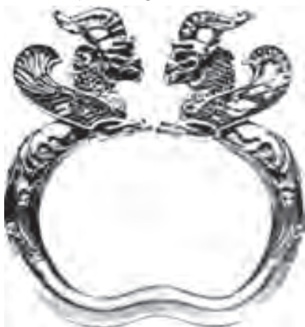
دستبند طلا، قرن ۵ ق.م (هخامنشی) موزه ویکتوریا و آلبرت ردپای بته جقه در بال و بدن حیوان دیده میشود.

به درخت و تقدس سرو دیده می شود، اما به علت اختلاف طبقاتی بسیار و اوضاع سیاسی، زندگی مردم ایران در آن دوره بسیار نابسامان بود. در این میان پیامبری اخلاقی به نام مزدک از بین مردم، برمی خیزد و تا حدودی می تواند در روند آن زمان تاثیر گذار باشد. در نهایت پادشاه و اطرافیان به علت احساس خطری که از جانب وی داشتند، او و بسیاری از پیروانش را از دم تیغ می گذرانند و درست از همین زمان سرو به حالت خمیده رسم و سمبل آزادی و جوانمردی می گردد. در بررسی هنر ساسانیان متوجه می شویم که در این دوره نیز مانند دوره هخامنشیان حیوانات بالدار بسیار مقدسند و به کرات از بالهایی که برگرفته از برگها و حتی سرو خمیده می باشند استفاده شده است.