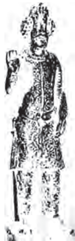
اشک دهم (سنتروک) پادشاه اشکانی

به درخت و تقدس سرو دیده می شود، اما به علت اختلاف طبقاتی بسیار و اوضاع سیاسی، زندگی مردم ایران در آن دوره بسیار نابسامان بود. در این میان پیامبری اخلاقی به نام مزدک از بین مردم، برمی خیزد و تا حدودی می تواند در روند آن زمان تاثیر گذار باشد. در نهایت پادشاه و اطرافیان به علت احساس خطری که از جانب وی داشتند، او و بسیاری از پیروانش را از دم تیغ می گذرانند و درست از همین زمان سرو به حالت خمیده رسم و سمبل آزادی و جوانمردی می گردد. در بررسی هنر ساسانیان متوجه می شویم که در این دوره نیز مانند دوره هخامنشیان حیوانات بالدار بسیار مقدسند و به کرات از بالهایی که برگرفته از برگها و حتی سرو خمیده می باشند استفاده شده است.