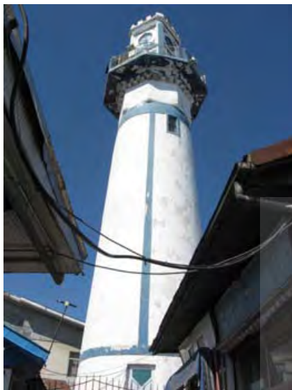
تصویر ۶. نمایی از بُرج ساعت (عکسبرداری سال ۱۳۸۷) برج توسط ساختمانهای اطراف محاصره شده است.

رابینو کنسول‌یار انگلیس در رشت، در کتاب تاریخ ولایات دارالمرز ایران، دربارهٔ این برج چنین نگاشته است: «فانوس دریایی به وسیلهٔ خسروخان از آجر بنا گردید و در انتهای حد شمالی شهر قرار گرفته است. با وجود آن که اکثراً آن را روشن نمی‌کردند، مزد نگهبان این بُرج در سال ۱۲۹۴ هجری قمری (معادل با ۱۲۵۶ شمسی)، ۲۵ تومان و پول روغن آن ۳۲۸ قران بود که تا سال ۱۳۲۷ هجری قمری (معادل با ۱۲۸۶ شمسی) این هزینه را در حساب عمومی گیلان منظور می‌کردند.» با توجه به نزدیکی زمان تحقیق رابینو با احداث برج ساعت چنین به نظر می‌رسد که وی تاریخ ساخت بُرج را صحیح نگاشته است.