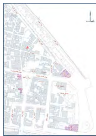
تصویر ۱. جانمایی برج ساعت بر روی نقشه شهری (وضع موجود)