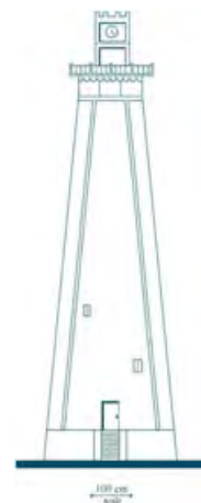
تصویر ۹. نمای ورودی برج ساعت بندر انزلی.