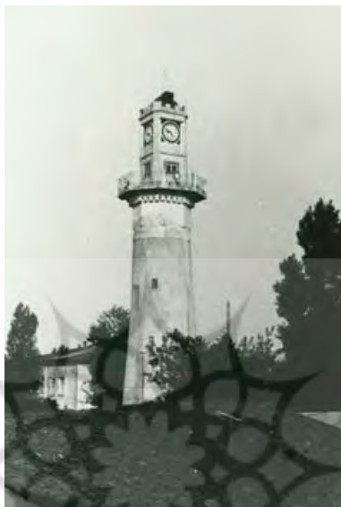
تصویر ۵. نمایی از برج ساعت بندر انزلی در دورهٔ پهلوی. محوطهٔ اطراف برج ساعت وسیع و به صورت باغ بود.