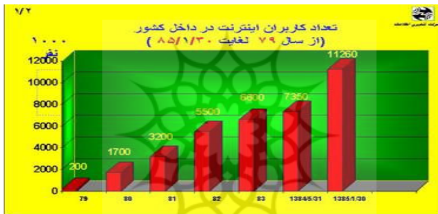
۲- نمودار رشد کاربران اینترنت در ایران از سال ۷۹ تا ۸۵

۲۰۰۶ حدود یک میلیارد و پنجاه میلیون نفر ذکر شد (Internet world statistics) و برای سال ۲۰۰۹ تعداد کاربران یک میلیارد و چهارصد میلیون نفر پیش بینی شده‌اند (Travel.com). آخرین آمار مربوط به جمهوری اسلامی ایران حاکی از آن است که تا پایان فروردین ماه ۱۳۸۵، تعداد کاربران اینترنت از مرز یازده میلیون نفر عبور کرده‌است (هفته‌نامه بزرگ‌تره فناوری).