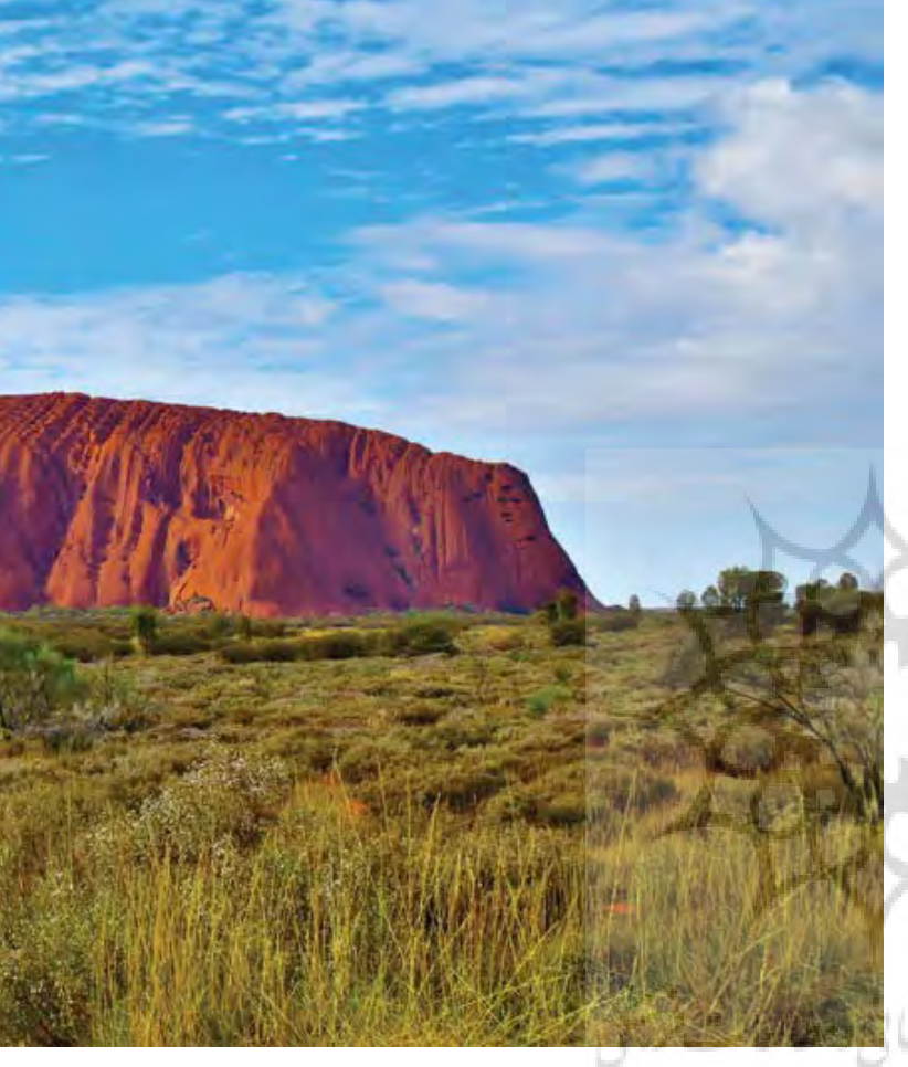
تصویر۲. اولارا کاتا جوتا، یارک ملی استرالیا.

Pic2. Uluru Kata Tjuta National Park, Australia.